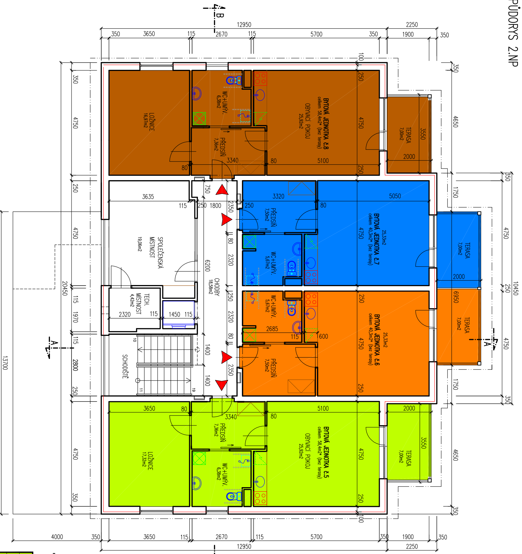
LEGENDA MÍSTNOSTÍ - 2.NP